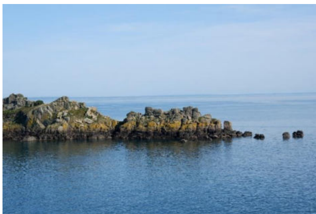
L'île des Landes La pointe du Grouin