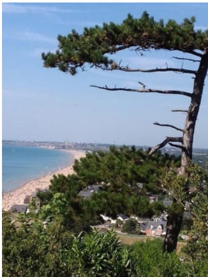
Carolles-Plage vue du Pignon Butor