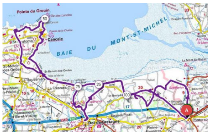
C2-Circuit breton (OPENRUNNER-fond de carte IGN)