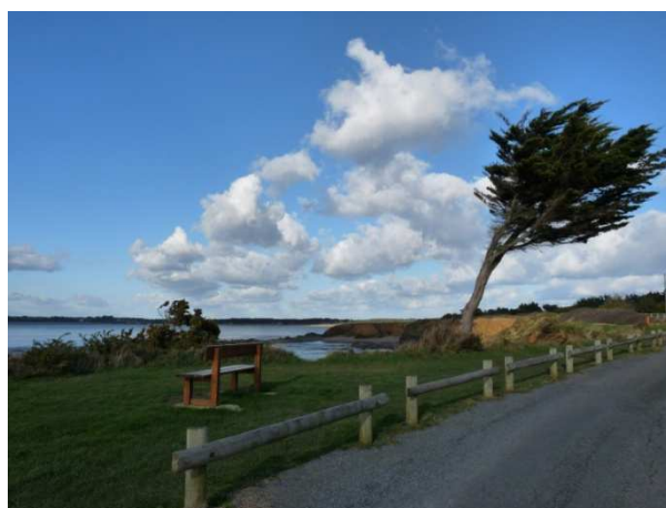
Pointe de Pen-Bé, l'Océan Atlantique