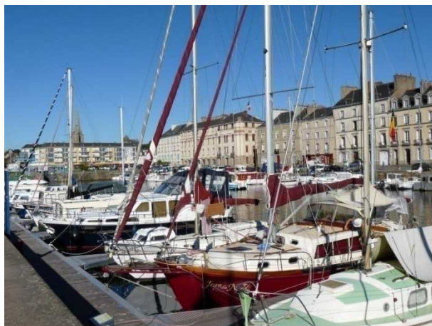
Le port de Redon