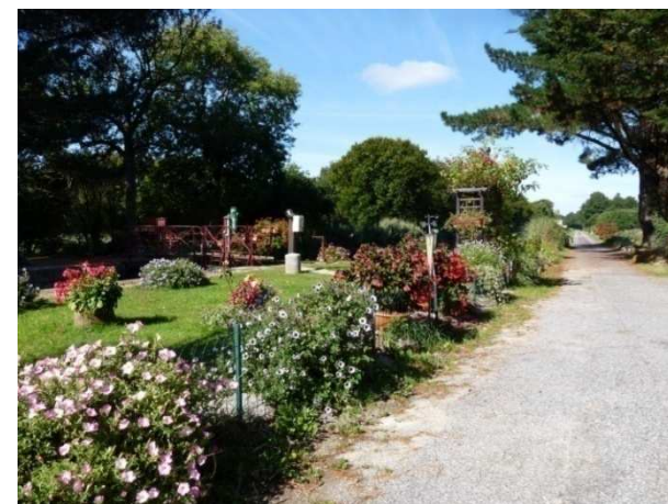
Chemin de halage canal de Nantes à Brest