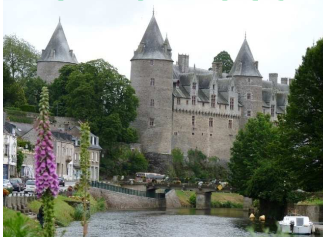
Le château de Josselin